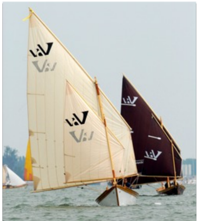
Vento di Venezia

Polo nautico e cantieristica tradizionale nell'isola della Certosa