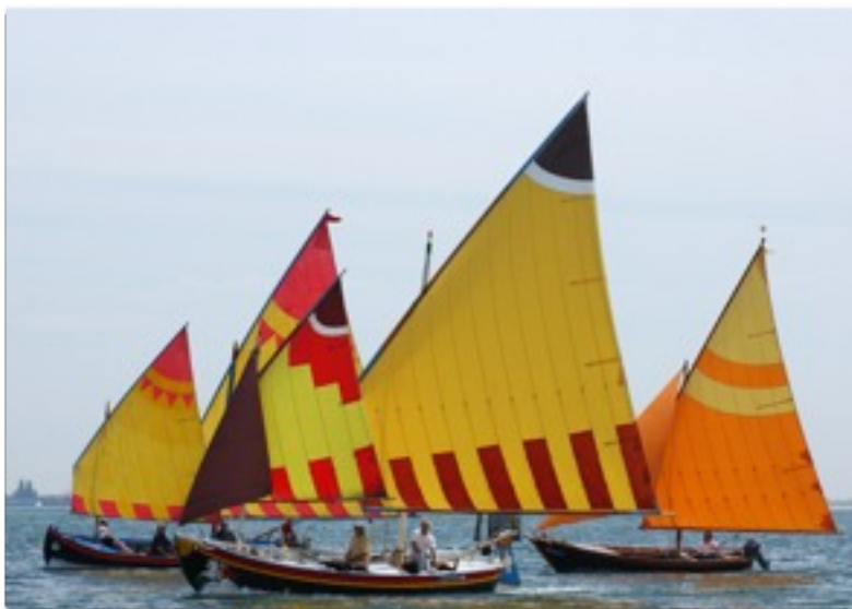
AVT Associazione Vela al Terzo

Attività didattico sportive legate alla Vela al Terzo, in laguna di Venezia