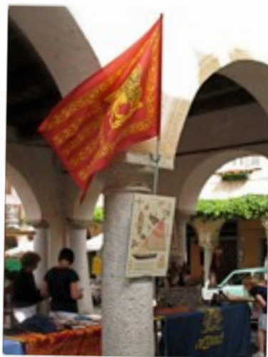
IDENTITA' DI MARE