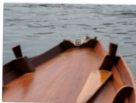
CULTURE MARINARE TIPOLOGIE DI IMBARCAZIONI