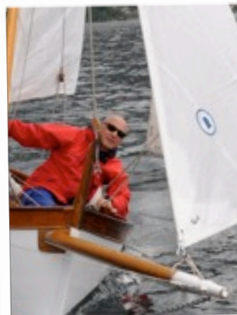
LE SFIDE: a vela, a voga, nel gusto