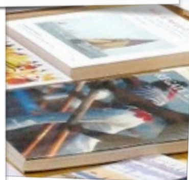
EDITORIA E MULTIMEDIA