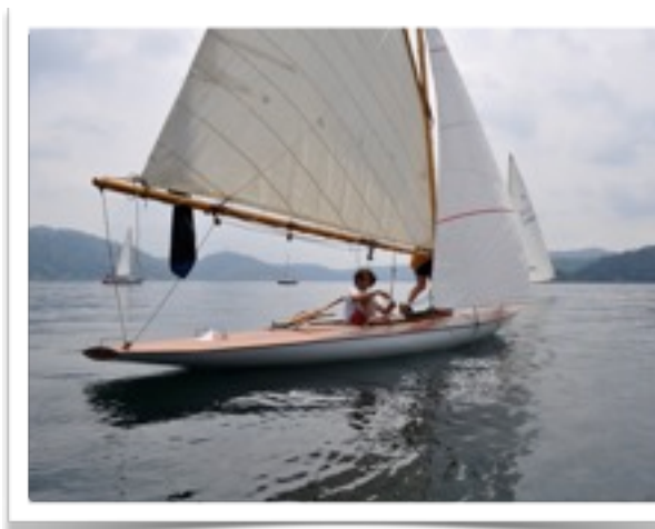
CIRCOLO VELICO ORTA

http://digilander.libero.it/amicisanpiero/