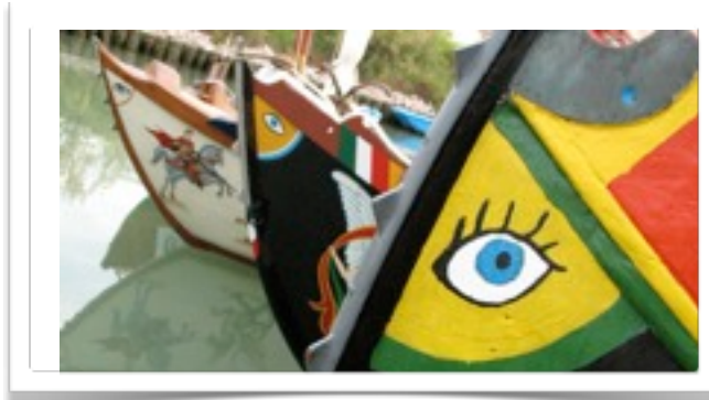
CIRCOLO VELICO CASANOVA

http://circolovelicocasanova.provincia.venezia.it